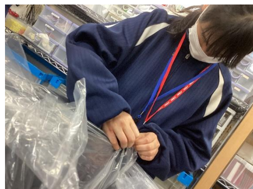
UNIQLO 店舗に出す服の袋むき