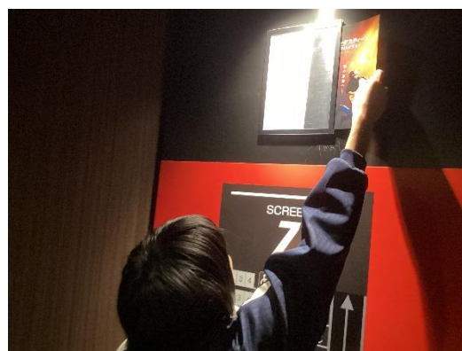
シネマサンシャイン チラシの入れ替え

11月19日（水）20日（木）に中学部3年生のミニインターンシップ（職場体験）を行いました。グループに分かれて、シネマサンシャイン土浦（映画館）、ノジマイオン土浦店（家電量販店）、ユニクロイオンモール土浦店（衣料品）にて、様々な仕事を体験することができました。限られた活動時間の中で、お客様と関わる活動や普段入れないバックヤードでの仕事など、貴重な経験をさせていただきました。生徒達からも、「勉強になった。」「緊張したけど、頑張れた。」などの感想がでており、充実した学びの時間となりました。