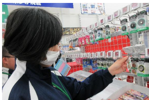
ノジマ 電池の品出し